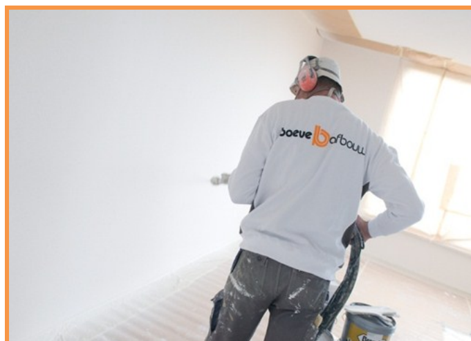
- Vakman Boeve Afbouw

Crystal spuitwerk levert bijzondere prestaties. Een pleister geschikt voor repareren, egaliseren en afwerken die voldoet aan alle wensen van de verwerker en opdrachtgever. Ook onder kritische omstandigheden. De pleister heeft een hoge hardheid en de witheid is uitzonderlijk. Daarnaast worden ook de perfecte vulling en de hoge dekking zeer gewaardeerd. Met de juiste structuur en uitstraling onderscheidt Crystal spuitwerk zich al tientallen jaren in de Nederlandse bouwmarkt.